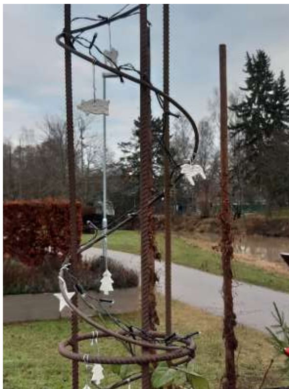
Åpromenaden sista december 2020. Hur kommer det att se ut i år? /Lena T.

Texter/Information: Redaktionskommittén ansvarar för texter som saknar signatur.